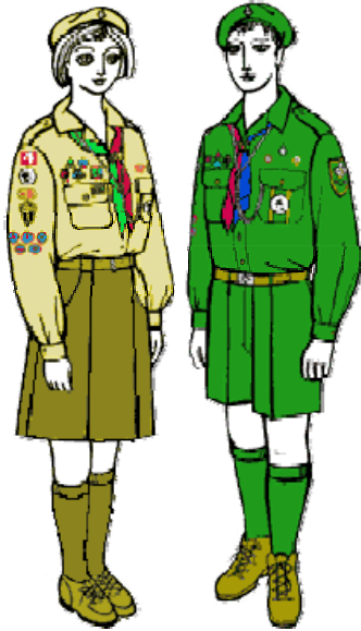
Рис. 3. ФО організації «Пласт». Україна, 1975 р.

бічними накладними кишнями (для дівчаток), а також хустки, гетрів, капелюха, светра та взуття.