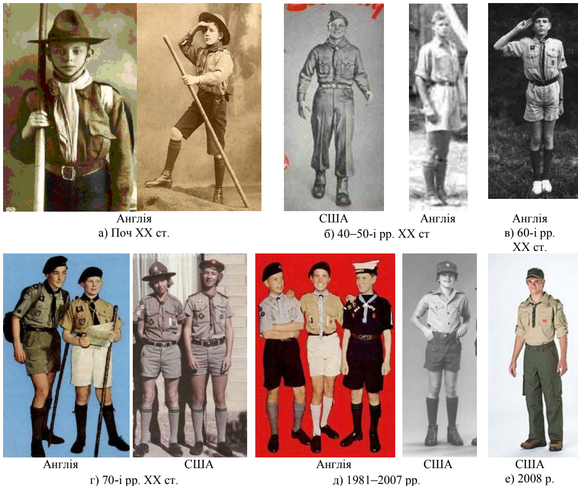
Рис. 2. Зовнішній вигляд скаутського ФО

Автором першого ФО для хлопчиків скаутів був Байден Павелл, який розробив скаутський ФО за аналогією одягу вояків південно-африканської поліції початку ХХ ст [18]. Без сумніву, походження та військова спеціальність засновника організації вплинули не лише на систему виховання скаутів, але й на їхній ФО. Цей одяг швидко розвивався і поширився саме в Англії та її колоніях. Тому ми прослідкували найбільш помітні етапи розвитку зовнішнього вигляду ФО скаутських організацій на прикладі Англії і США (рис. 2).