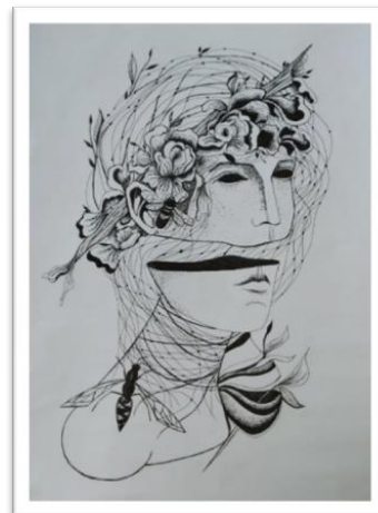
Рис. 2. Стилiзована голова. Макогін А.