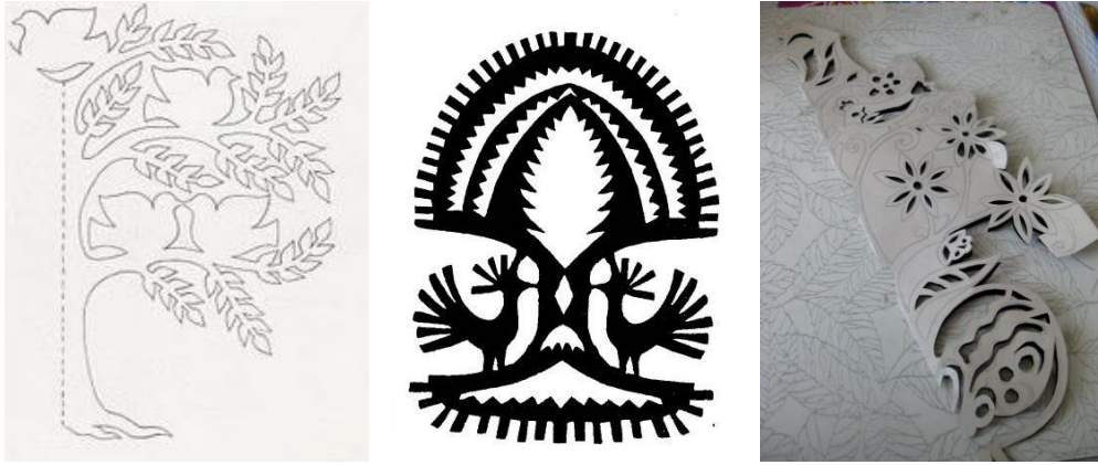
Рис. 1. Приклади характеру трафаретів та їх створення

Головними мотивами, окрім геометричних, з часом ставали природні мотиви: квіти, листя, звірі, тварини, птахи. У кожному природному об'єкті народні майстри уміли знайти головну декоративну характеристику й так промальовувати і спростити (стилізувати) узор, щоб він гармонійно зливався воедино з площиною тканини не руйнуючи її. Такими візерунками прикрашали набивні хустки, в яких центральна композиція об'єднується з каймовою або сітчастою. По центру площини – квіткові мотиви або великі квіти на широкій каймі. Поєднання малих і великих квітів у композиції друкованого виробу додає йому певної етно стилістики та динамічності [2].