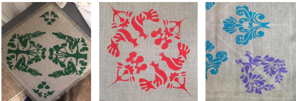
Рис. 2. Приклади декорування тканини методом трафаретного друку здобувачів вищої освіти спеціальності 023 ОДМ «Художній текстиль»

Народну стилістику використовують й здобувачі вищої освіти спеціалізації «художній текстиль» кафедри технологічної та професійної освіти і декоративного мистецтва ХНУ, спеціальності 023 ОДМ (рис. 2).