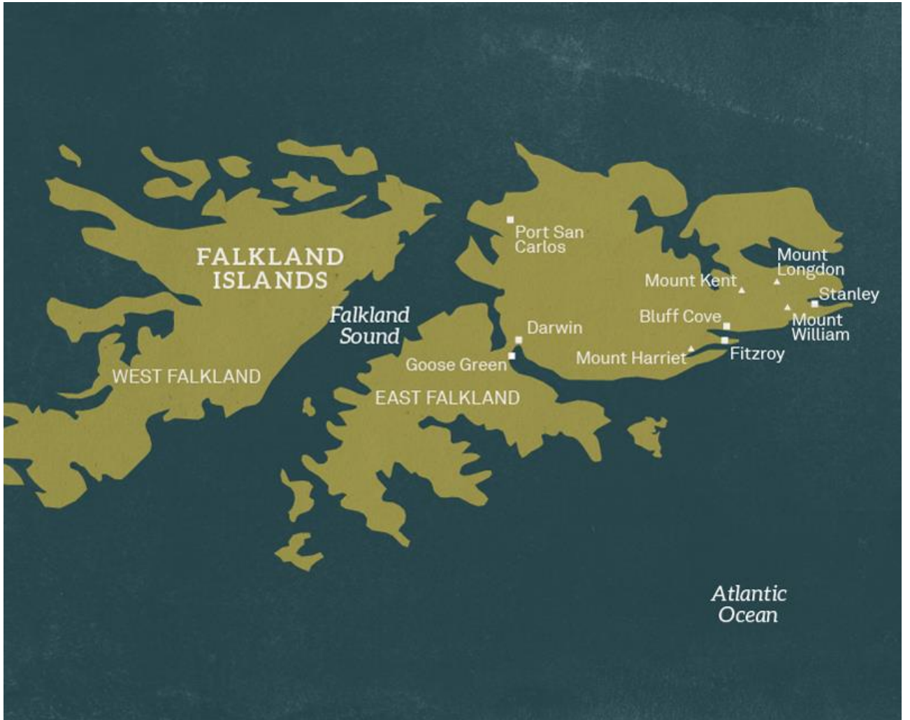
Рис. Д 2.3 Карта Фолклендських островів