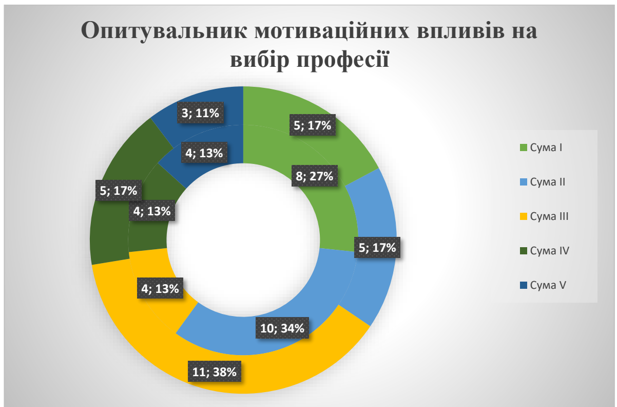
Рис.2.3. Аналіз результатів опитувальника мотиваційних впливів на вибір професії (переклад О. Сидоренко)

Сума V. Інтегративна мотивація. Узгодженість завдань працівника із завданнями фірми: бажання досягати мети, що відповідає інтерналізованим цінностям. Дівчатка (11%), хлопчики (13%).