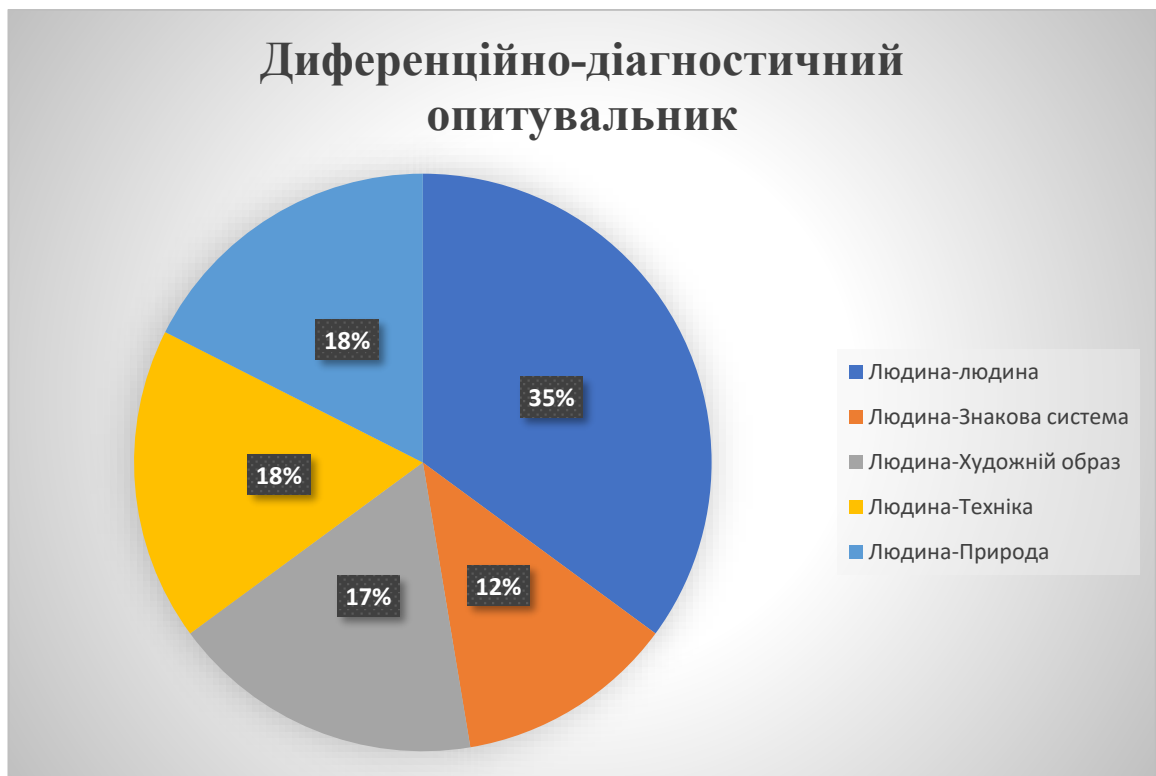
Рис.2.1. Аналіз результатів за методикою «Диференційно – діагностичний опитувальник» за Клімовим.

У виборі «Людина – Техніка» надали перевагу 18% респондентів. Також старшокласників приваблює вибір типу професій «Людина – Художній образ» 17%. Це можна пояснити вподобаннями учнів та їх схильностями до відповідного типу професій.