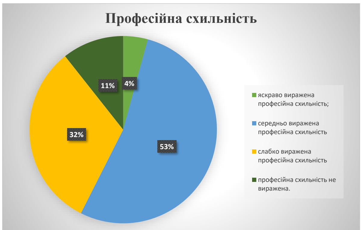
Рис. 2.4 – Розподіл кількості досліджуваних старшокласників за рівнем професійної схильності за методикою Л. О. Йовайши

У 5 старшокласників (11 %) професійні схильності не виявлено, що вказує на потребу в додатковій профорієнтаційній підтримці та розширенні уявлень про можливі напрями розвитку.