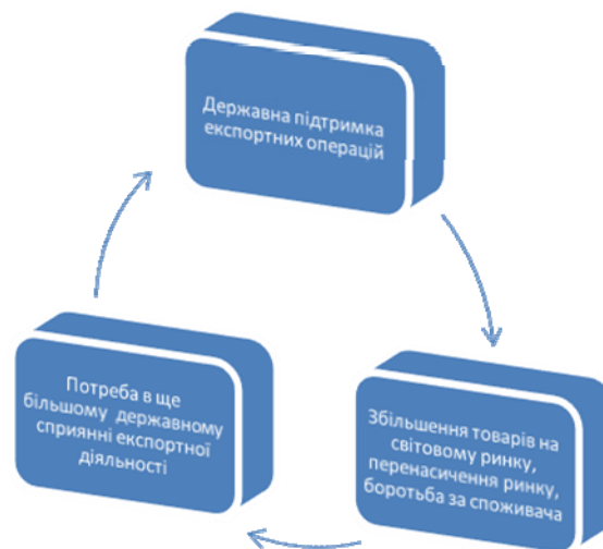
Рис. 2. Сприяння експорту як «замкнене коло»

Але можемо зауважити, що прослідковується тенденція (схематично зображена на рис. 2), яка проявляється в практиці підтримки експортерів і являється однією з причин постійної участі держави в цьому процесі.