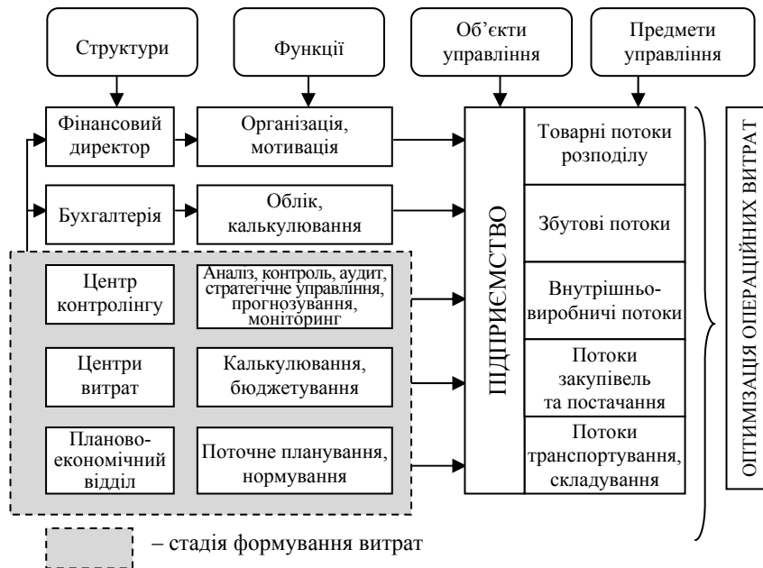
Рис. 1. Організаційно-інформаційна система управління витратами на підприємстві

Як видно із запропонованої системи, управління витратами охоплює весь комплекс господарських операцій. Враховуючи, що об'єктами управління на підприємствах є потоки, управління витратами здійснюється окремо за кожним з існуючих видів потоку, а в межах потоку за його складовими елементами. Так, на стадії закупівель основним об'єктом управління логістичними витратами є витрати закупівельних багатоасортиментних потоків, а в межах потоку закупівель витрати за окремим асортиментом закупівлі.