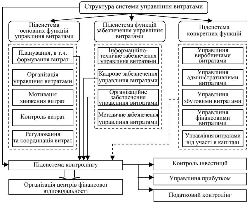
Рис. 4. Структура системи управління витратами на промисловому підприємстві

Запропоновано модель оцінювання ефективності управління витратами промислового підприємства на засадах системного підходу, що спрямована на визначення окремих етапів процесів управління витратами та встановлення конкретних осіб, що будуть відповідати за ефективність впровадження даних процесів. Її впровадження є основою для створення на підприємстві ефективної системи управлінського обліку, організації поточного та оперативного планування, аналізу і контролю за діяльністю в розрізі формування витрат.