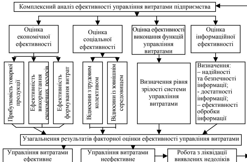
Рис. 2. Схема комплексної оцінки ефективності управління витратами промислового підприємства

Розгляд наявних теоретичних і практичних точок зору щодо якості управління на підприємстві, а також щодо ефективності витрат надав можливість виокремити такі підходи до оцінки в управлінні витратами: соціально-економічна ефективність, успішність інформаційних технологій, а також здійснення функцій менеджменту (рис. 2).