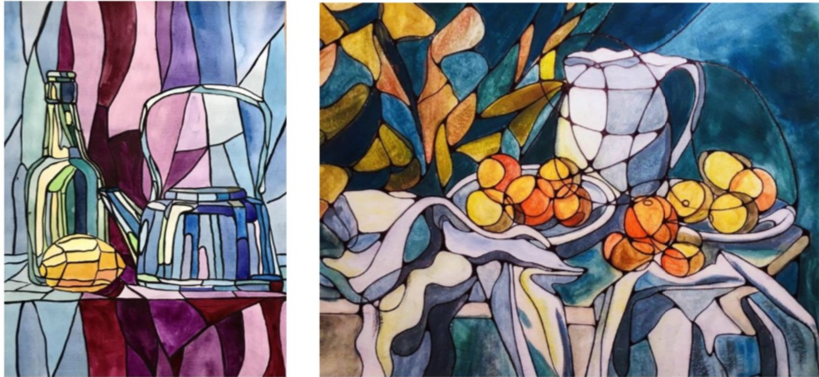
Рис. 1-2. Творчі роботи студентів Хмельницького національного університету.

Також, враховуючи спеціалізацію (декоративне мистецтво), особливу увагу у вивченні дисципліни «Живопис» приділяємо художній стилізації. Для виконання таких завдань за основу беремо роботу виконану з натури (наприклад, натюрморт, портрет тощо) і перетворюємо її шляхом трансформації форми, інтерпретації кольорів та фактур у творчу композицію. Такий підхід (стилізований, декоративний) базується на рівні почуттів та емоції, на перетворення натурального зображення у виразний художній образ, навчаючи аналізувати та досліджувати натурну постановку, застосовувати геометризацию та узагальнення, виховуючи у студентах естетичний смак і культуру живописної мови (рис. 1-2).