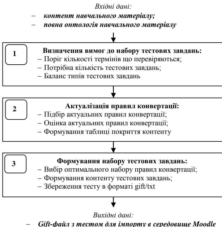
Рис. 1 – Схема інформаційної технології автоматизованого формування тестових завдань

В основі функціонування інформаційної технології автоматизованого формування тестових завдань [5] є використання набору правил перетворення фрагментів контенту у тестові завдання. Для цього спочатку встановлюються вимоги до набору тестових завдань, визначаються актуальні правила конвертації й на основі найбільш прийнятних із них формується набір тестових завдань, як це показано на рисунку 1.