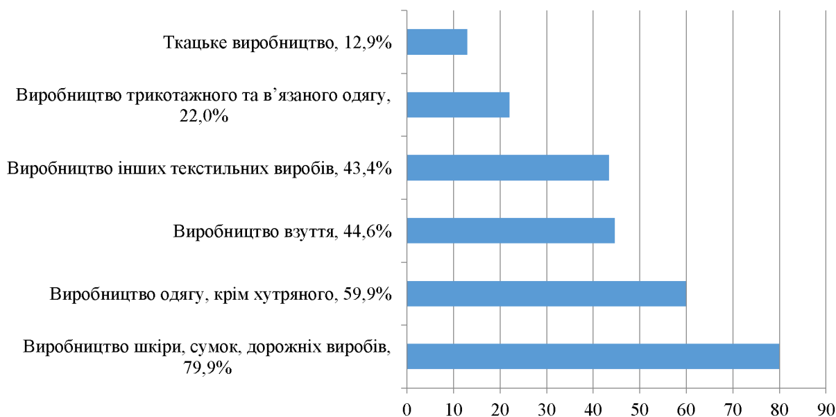
Рис. 2. Галузева експортоорієнтованість продукції легкої промисловості в 2020 році

спроможності населення. Через таку ситуацію на вітчизняному ринку національні виробники змушені виконувати замовлення іноземних брендів. Про що свідчить висока експортоорієнтованість галузі та залежність від кон'юнктури світових ринків. Якщо раніше частка реалізованої продукції за межі країни становила у середньому 40-43%, то за січень-лютий 2020 року – 51,6%. При цьому у січні-лютому 2020 року обсяги експортованого одягу складають 59,9%, виробництво трикотажного та в'язаного одягу – 22% (рис.2).