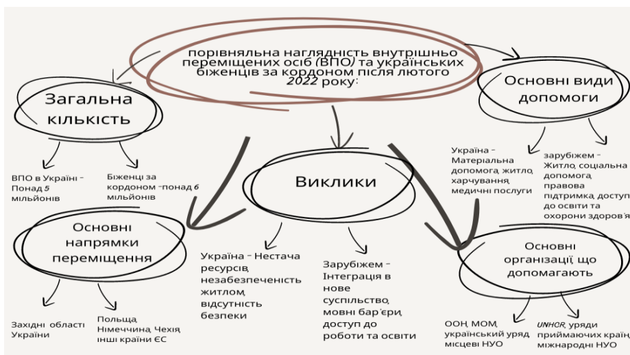
Рисунок 2.2 Порівняльна наглядність між внутрішніми та зовнішніми мігрантами

Порівняльна наглядність внутрішньо переміщених осіб (ВПО) та українських біженців за кордоном після лютого 2022 року: кількість, виклики, організації, які допомагають (рис. 2.2).