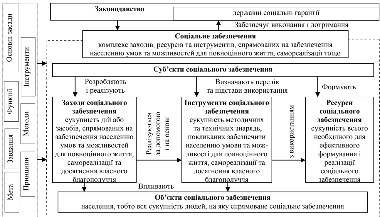
Рис. 2. Державне соціальне забезпечення в механізмах реалізації соціальної політики*

Наступна важлива складова досліджуваного механізму – державне соціальне забезпечення. По суті, процес державного соціального забезпечення сам по собі також є механізмом. Окремі елементи механізму державного соціального забезпечення вже розглядалися нами раніше, а тому акцентуємо нашу увагу на тих моментах, які ще не досліджувалися. Зокрема, представимо побудовану нами структуру означеного механізму на рис. 2.