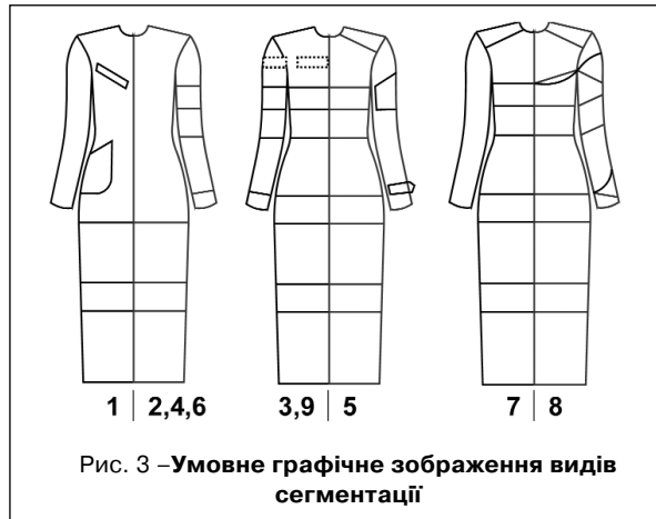
Рис. 3 – Умове графічне зображення видів сегментації