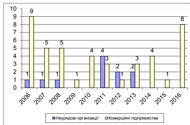
Рис. 2. Розподіл діючих членів Глобального договору ООН України за часом їх приєднання до цієї ініціативи

Сьогодні учасниками мережі Глобального Договору ООН в Україні залишаються лише 55 компаній, з яких 11 – це неурядові організації, 44 – комерційні підприємства. На рисунку 2 [9] подано розподіл діючих членів Глобального договору ООН України за часом їх приєднання до цієї ініціативи.