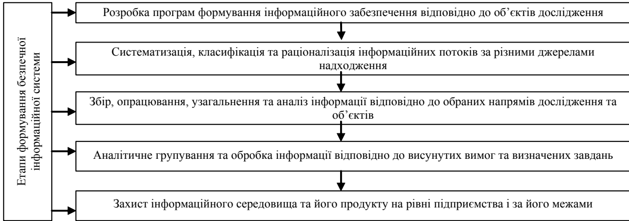
Рис. 2. Етапи формування безпечної інформаційної системи суб'єкта господарювання