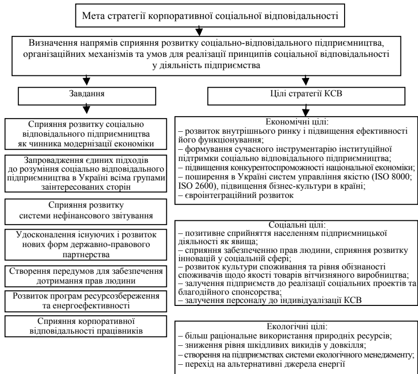
Рис. 3. Мета, завдання та цілі формування стратегії корпоративної соціальної відповідальності

Зроблений висновок, що соціально відповідальне підприємство володіє більш широким колом можливостей з нейтралізації соціальних ризиків, що є безсумнівною перевагою порівняно з підприємствами, які ігнорують соціальну діяльність. Запропоновано формування стратегії управління ризиками недотримання корпоративно-соціальної відповідальності підприємства з урахуванням інтересів усіх зацікавлених сторін. Розроблено Програму управління соціальними ризиками на підприємствах, що орієнтована на вправдження у практичну діяльність принципів корпоративно-соціальної відповідальності. Метою стратегії КСВ є визначення напрямів сприяння розвитку соціальної відповідальності підприємства, організаційних механізмів та умов для інтеграції соціальної відповідальності у діяльність підприємств для забезпечення сталого розвитку виробничих систем, зростання суспільного добробуту та вирішення питань, визначених у національних програмних документах (рис. 3).