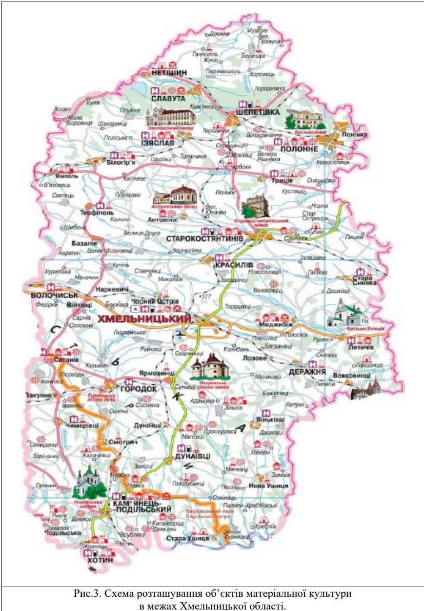
Рис.3. Схема розташування об'єктів матеріальної культури в межах Хмельницької області.