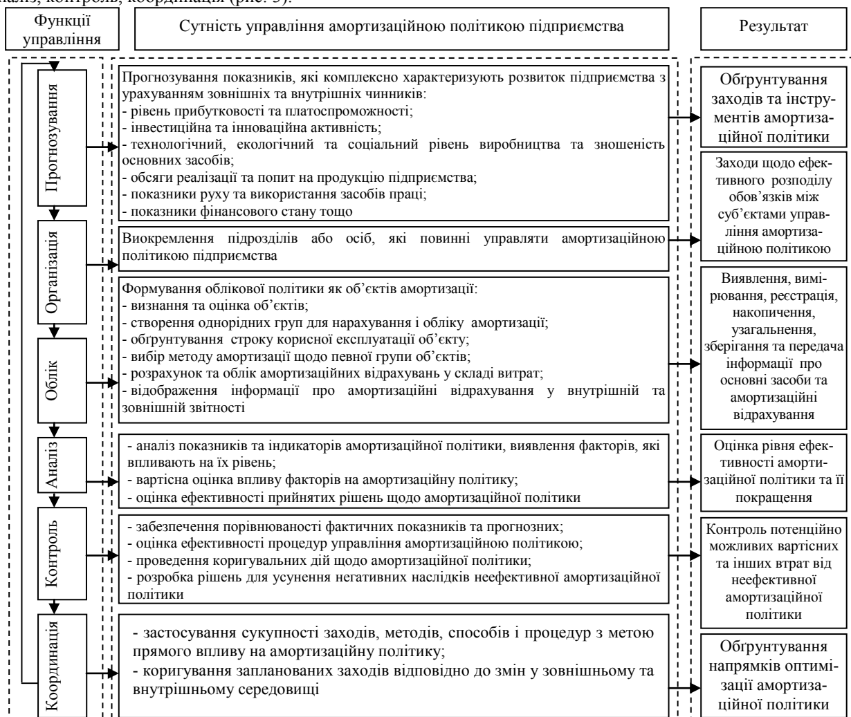
Рис. 3. Функціональна складова організаційно-економічного механізму управління амортизаційною політикою підприємства *

Зазначені підсистеми організаційно-економічного механізму, виконуючи певні функції, доповнюють і накладаються при здійсненні управління, тим самим утворюючи комплексний організаційно-економічний механізм управління амортизаційною політикою підприємства. Тому, виокремлюючи функціональний підхід до побудови такого механізму, вважаємо за доцільне до основних функцій управління саме амортизаційною політикою відносити: планування (прогнозування), організація, облік, аналіз, контроль, координація (рис. 3).