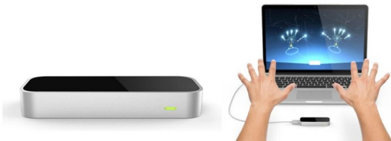
Рисунок 1 – Пристрій Leap Motion

Основна частина Контролер Leap Motion (LMC) – це безконтактний сенсорний пристрій без маркерів, розроблений компанією Leap Motion [1]. Його основне призначення це виявлення жестів рук та положення пальців в інтерактивних програмних середовищах (рис. 1).