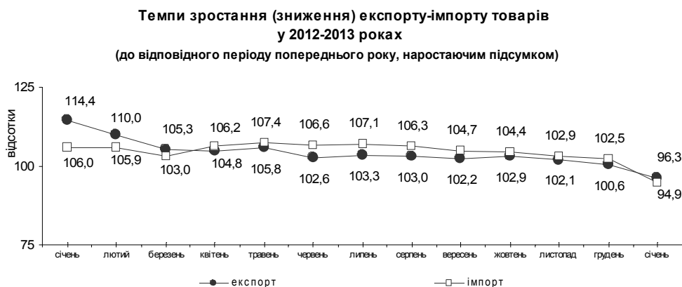
Рис. 1. Темпи зміни експорту-імпорту товарів за 2012–2013 роки

Виклад основного матеріалу. Ефективний розвиток будь-якої торгівлі неможливий без здійснення інтеграційних процесів та розвитку економічних зв'язків з іншими країнами. Традиційною і найбільш розвинутою формою міжнародних економічних зв'язків є міжнародна торгівля, тому вона виступає основною складовою зовнішньоекономічної політики держави.