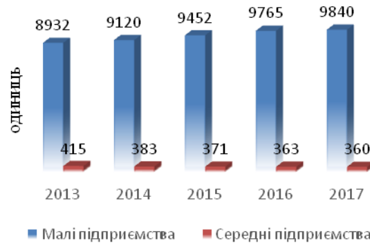
Рис. 1. Динаміка кількості малих і середніх підприємств у 2013–2017 рр.

Динаміка кількості малих та середніх підприємств Хмельницької області протягом 2013–2017 років зображена на рис. 1.