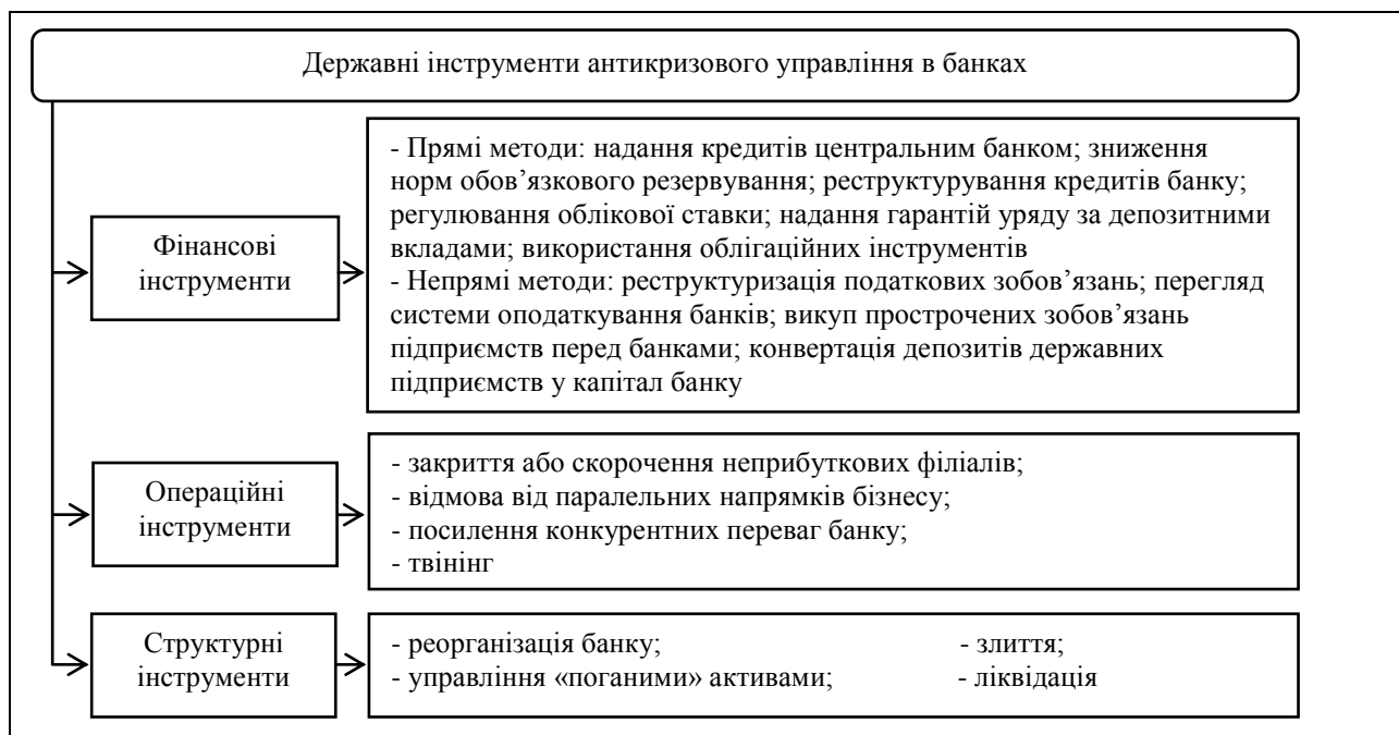
Рис. 2. Інструменти державного антикризового управління в банках

інструменти управління процесами виходу з кризи, яке здійснюють і для мінімізації можливості її повторення в майбутньому.