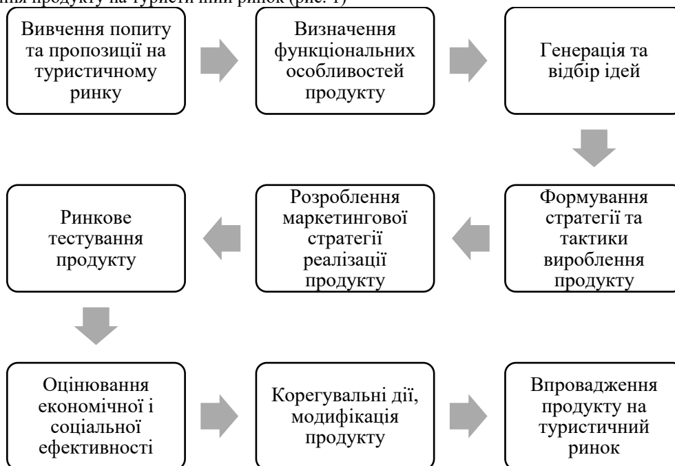
Рис. 1. Процес створення туристичного продукту

Процес створення туристичного продукту суб'єктом господарювання включає наступні основні види діяльності: визначення попиту та пропозиції на туристичному ринку; визначення функціональних особливостей продукту; генерація та відбір ідей; формування стратегії і тактики вироблення туристичного продукту; розроблення маркетингової стратегії реалізації продукту на туристичному ринку; ринкове тестування; оцінювання економічної і соціальної ефективності; корегувальні дії, модифікація продукту; впровадження продукту на туристичний ринок (рис. 1)