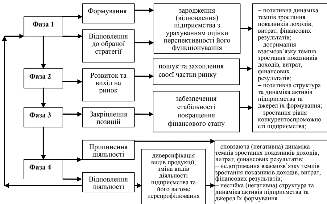
Рис. 3. Зв'язок фаз функціонування суб'єктів малого бізнесу з результативністю їх діяльності