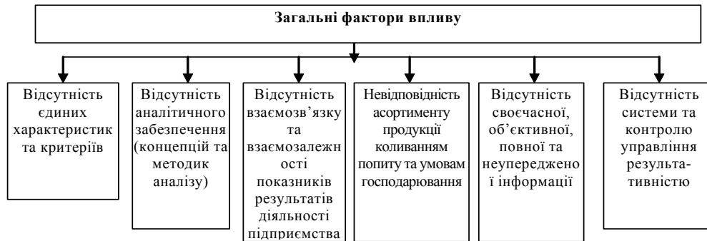
Рис. 2. Загальні фактори впливу на результативність діяльності

здійснюється шляхом придбання його чистих активів або контрольного пакету акцій. Злиття підприємств відбувається шляхом об'єднання підприємств і створенням нової юридичної особи, або приєднанням до головного підприємства. Ліквідація підприємств може статися у разі банкрутства, на підставі рішення суду, з власної ініціативи та ін.