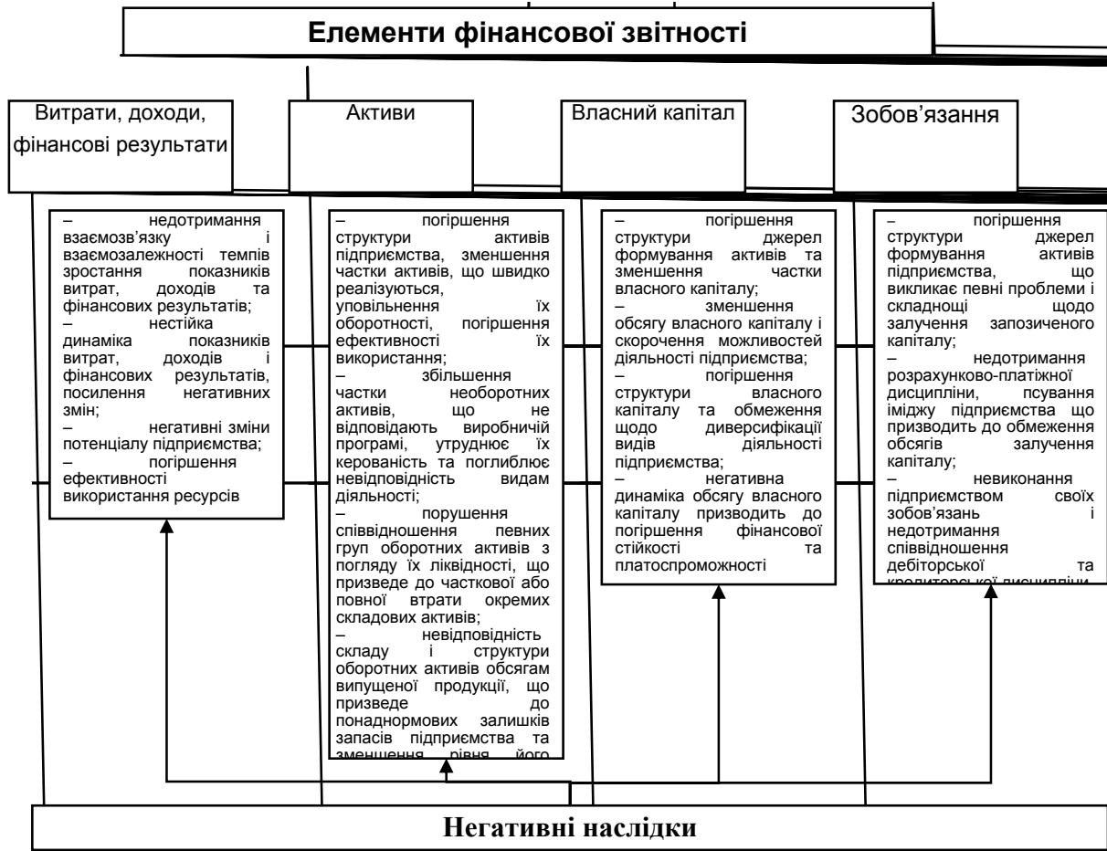
Рис. 4. Ознаки негативних тенденцій розвитку суб'єктів господарювання у розрізі елементів фінансової звітності

– показники результативності функціонування: повна собівартість продукції (товарів, робіт, послуг); дохід (виручка) від реалізації продукції (товарів, робіт, послуг); чистий фінансовий результат (прибуток (збиток));