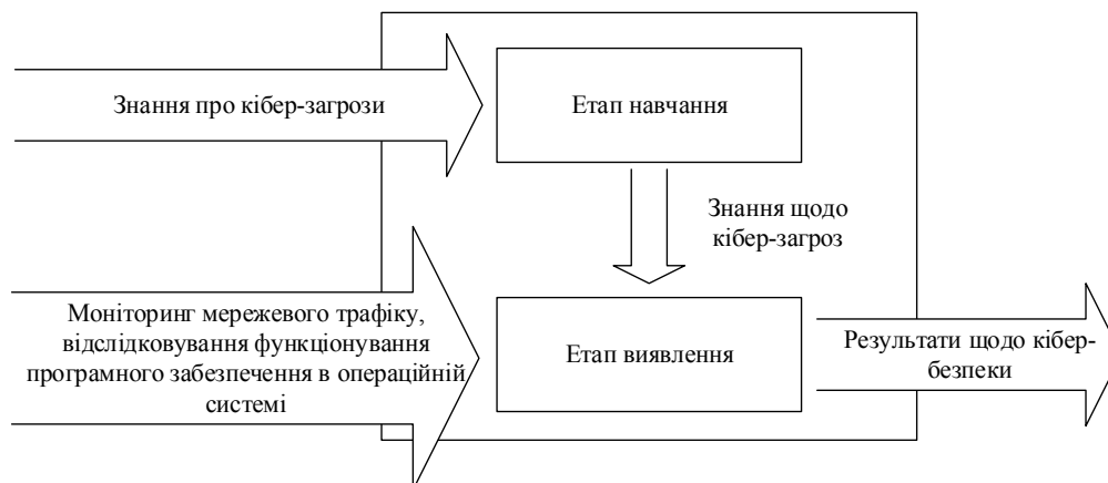
Рис. 1. Укрупнена схема функціонування методу виявлення кібер-загроз на основі еволюційних алгоритмів

Укрупнена схема функціонування методу виявлення кібер-загроз на основі еволюційних алгоритмів подана на рис. 1.