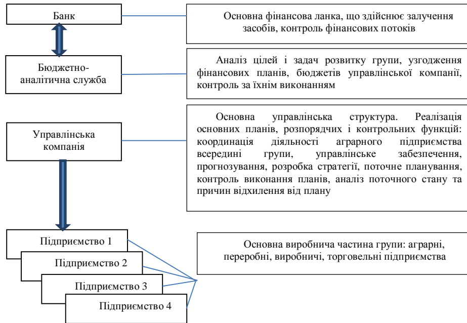
Рис. 5. Варіант управлінської організаційної структури аграрного бізнесу в умовах міжнародної диверсифікації

Розглянемо найвідповідніший традиційним стратегічним і поточним цілям варіант управлінської організаційної структури аграрного бізнесу в умовах міжнародної диверсифікації (рис. 5).