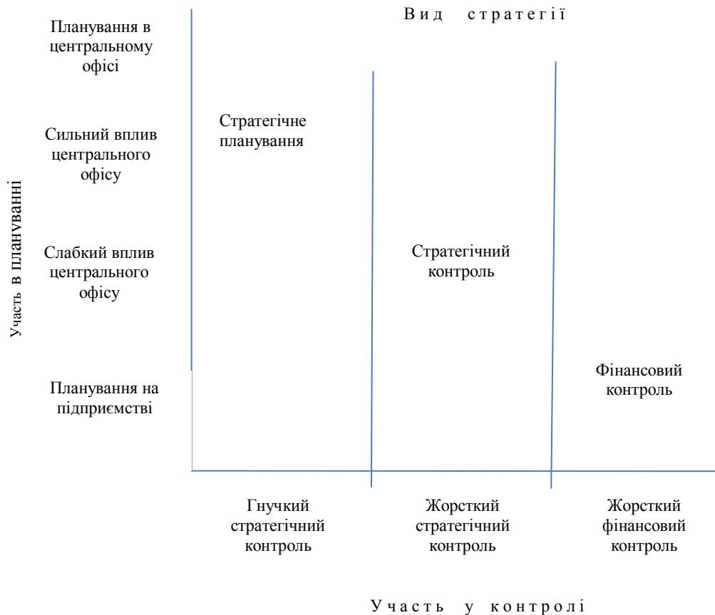
Рис. 3. Залежність способу управління аграрним підприємством в умовах міжнародної диверсифікації бізнес-діяльності від жорсткості його управлінської вертикалі

підприємствами, що характеризують різні варіанти управлінської жорсткості системи (рис. 3).