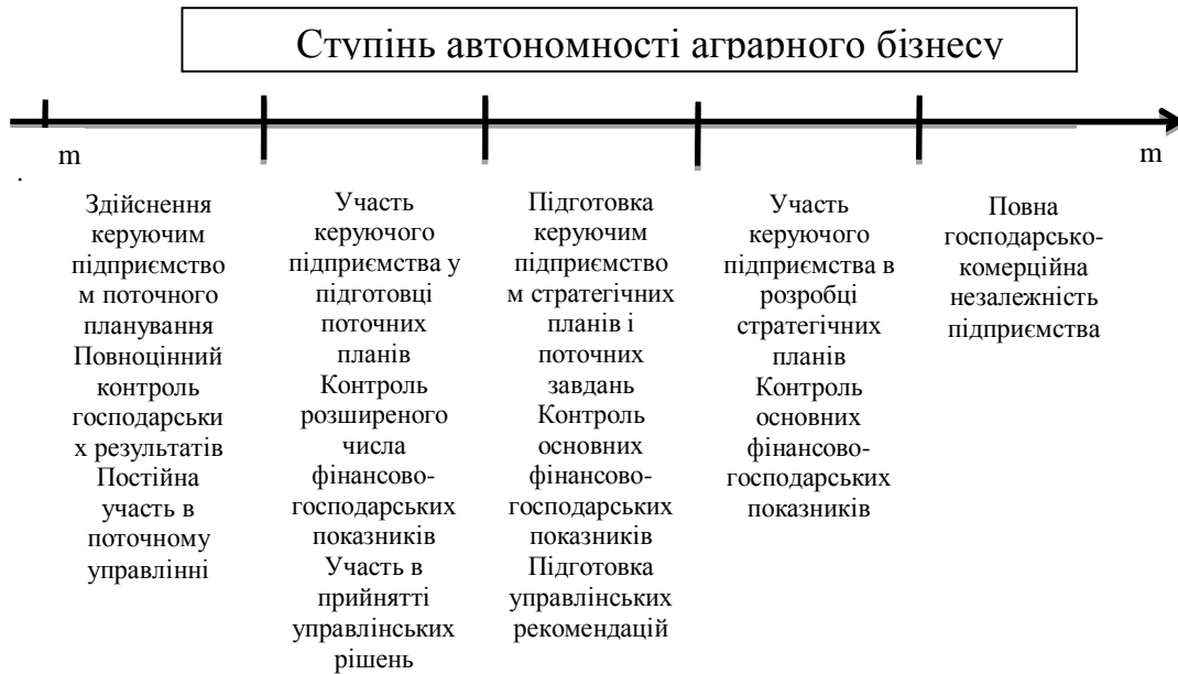
Рис. 4. Вплив жорсткості управлінської вертикалі на функціональне навантаження керуючого підприємства аграрного бізнесу

На нашу думку, важливим завданням є визначення відповідності гнучкості або мобільності управління потребам групи та її перспективам, а саме: оцінка стратегічних цілей акціонерів, їхнього погляду на ведення бізнес-діяльності в умовах міжнародної диверсифікації, вивчення перспектив виходу на зарубіжні аграрні ринки, особливостей, пов'язаних із територіальним розташуванням підрозділів аграрного підприємства, масштабів бізнес-діяльності, господарського стану аграрних підприємств, рівень кадрово-управлінського потенціалу.