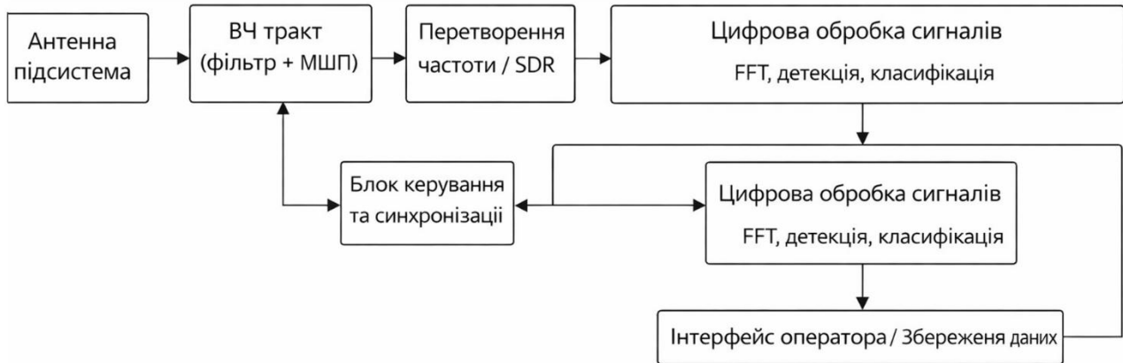
Рисунок 1. Структурна схема системи радіотехнічного моніторингу

Структурна побудова системи радіотехнічного моніторингу визначається її функціональним призначенням: прийманням, селекцією, перетворенням, цифровою обробкою та відображенням радіосигналів у заданому частотному діапазоні. Узагальнена структурна схема запропонованої системи наведена на рисунку 1.