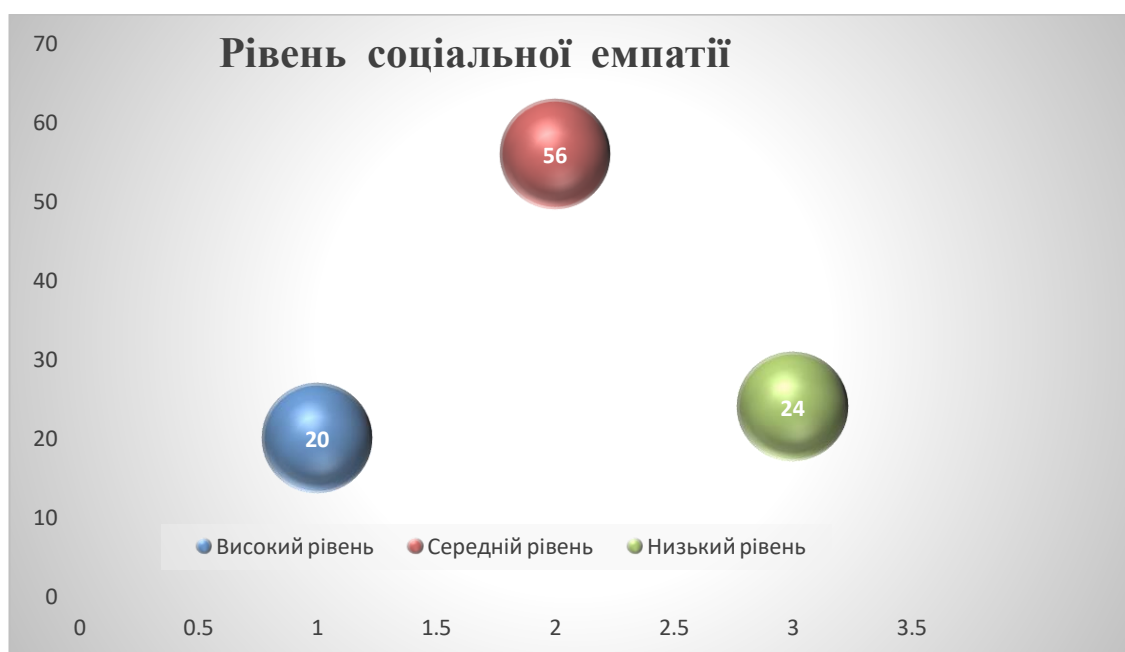
Рис. 2.4 – Рівень соціальної емпатії

Індекс емпатійності знаходимо підсумовуючи відповіді, що співпали з питаннями «так» або «ні». Результати методики поданні на рисунку 2.4.