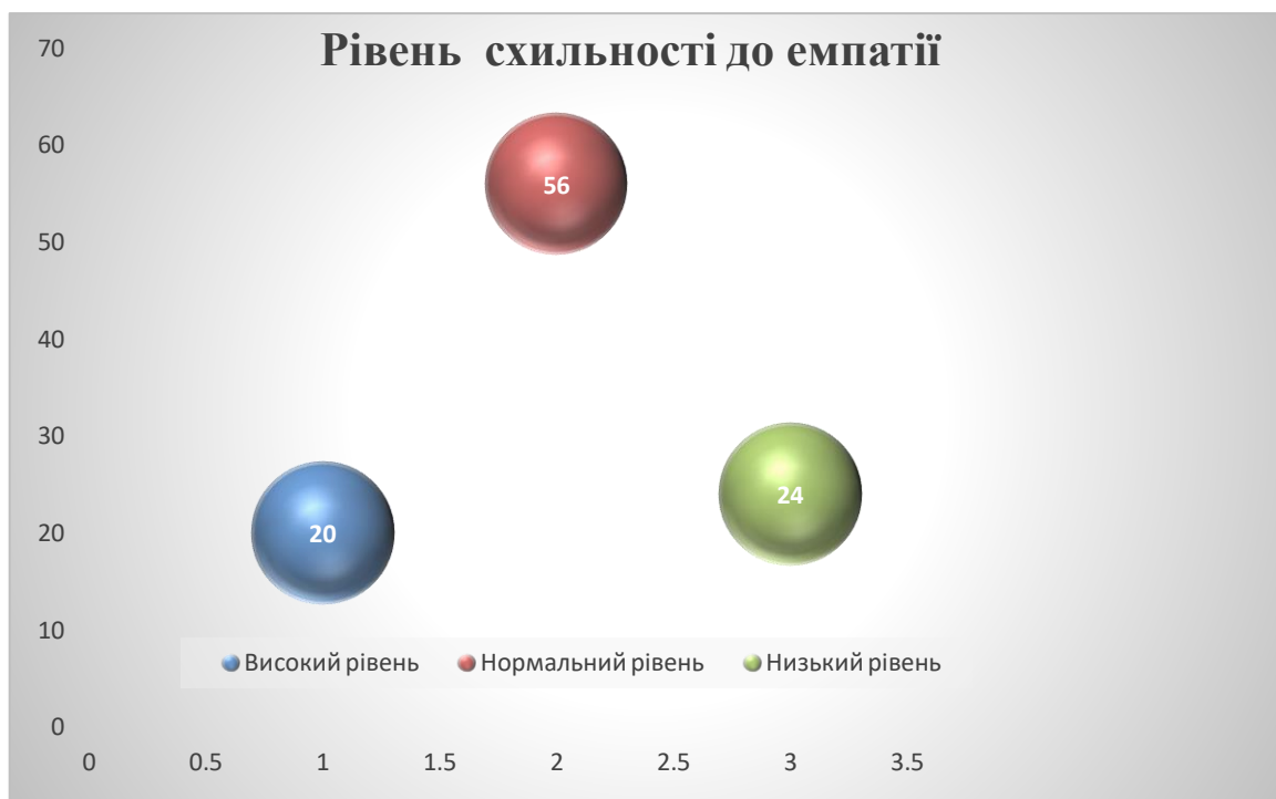
Рис. 2.2 – Рівень схильності до емпатії

Результати тестування за «Методикою виявлення схильності до емпатії» свідчать про наявність таких рівнів емпатійності педагогів.