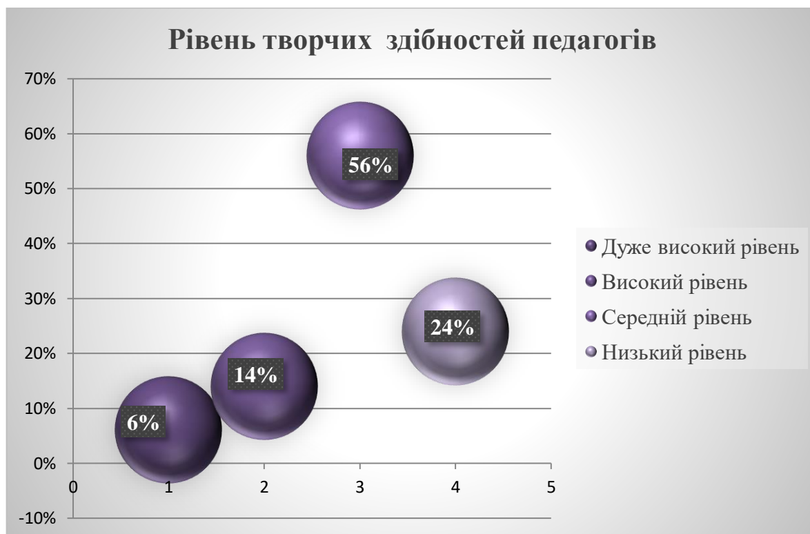
Рисунок 2.3 – Результати за «Методикою визначення творчих здібностей»

Результати методики поданні на рисунку 2.3.