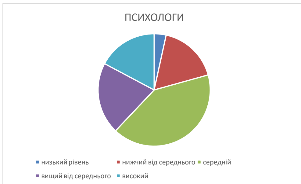
Рис. 2.1 Розподіл результатів інтегральних показників за рівнями (методика Гілфорда-Саллівена) у студентів-психологів.

Розподіл результатів діагностики соціального інтелекту за рівнями у студентів-психологів представлено на діаграмі (Рис. 2.1)