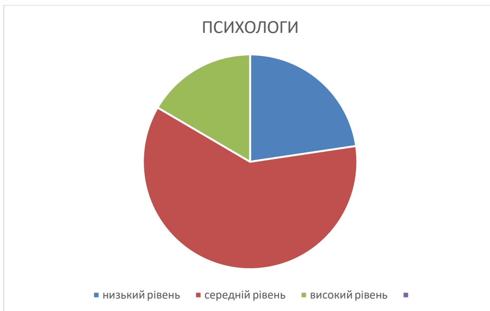
Рис. 2.4. Розподіл результатів діагностики рефлексивності за рівнями у майбутніх психологів.

Аналіз результатів діагностики рівня розвитку рефлексивності майбутніх психологів і економістів дозволяє зробити такі висновки.