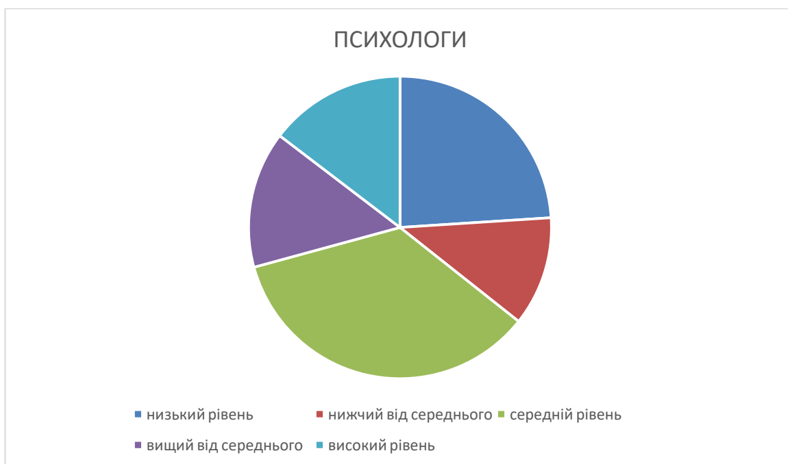
Рис. 2.10. Розподіл за рівнями результатів діагностики за параметром «толерантність» у майбутніх психологів.

Графічна презентація результатів діагностики за параметром «толерантність» у майбутніх психологів представлені на діаграмі (Рис.2.10.).