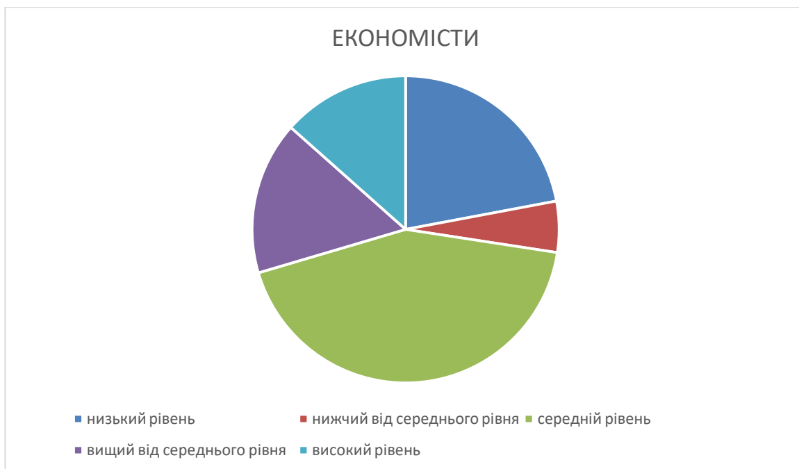
Рис. 2.7. Розподіл за рівнями результатів діагностики за параметром «прагнення до згоди» у майбутніх економістів.

Графічна презентація результатів діагностики за параметром «прагнення до згоди» у майбутніх психологів представлені на діаграмі (Рис.2.8.)