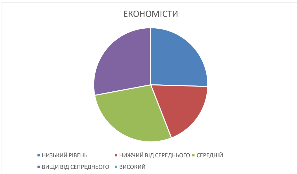
Рис. 2.11. Розподіл за рівнями результатів діагностики за параметром «оптимізм» у майбутніх економістів.

Графічна презентація результатів діагностики за параметром «оптимізм» у майбутніх економістів представлені на діаграмі (Рис.2.11.)