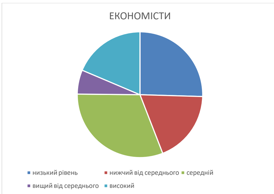
Рис.2.5. Розподіл результатів діагностики соціально-комунікативної комперентності за рівнями у майбутніх економістів.

Графічна презентація результатів діагностики соціально-комунікативної комперентності майбутніх економістів представлені на діаграмі (Рис.2.6.)