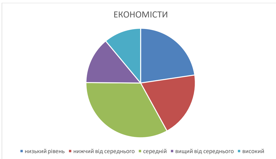
Рис. 2.13. Розподіл за рівнями результатів діагностики за параметром «фрустраційна толерантність» у майбутніх економістів.

Графічна презентація результатів діагностики за параметром «фрустраційна толерантність» у майбутніх економістів представлено на діаграмі (Рис.2.13.)