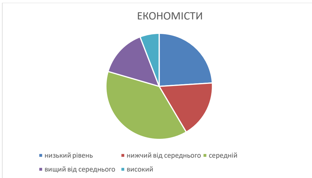
Рис. 2.2. Розподіл результатів інтегральних показників за рівнями (методика Гілфорда-Саллівена) у студентів-економістів.

Розподіл результатів діагностики соціального інтелекту за рівнями у студентів-економістів представлено на діаграмі (Рис. 2.2)