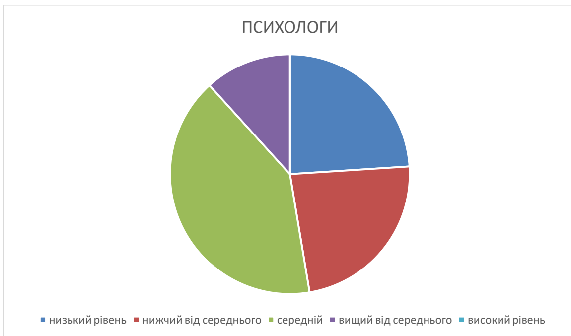
Рис. 2.14. Розподіл за рівнями результатів діагностики за параметром «фрустраційна толерантність» у майбутніх психологів.

Графічна презентація результатів діагностики за параметром «фрустраційна толерантність» у майбутніх психологів представлено на діаграмі (Рис.2.14.)