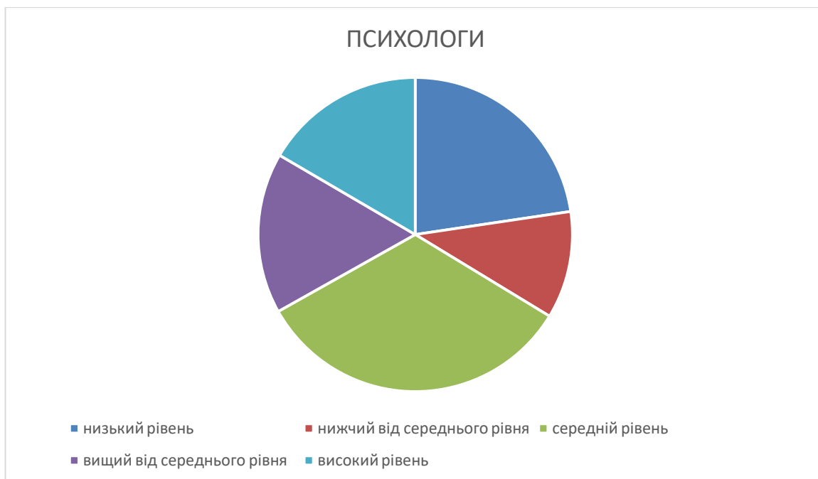
Рис. 2.8. Розподіл за рівнями результатів діагностики за параметром «прагнення до згоди» у майбутніх психологів.

Графічна презентація результатів діагностики за параметром «прагнення до згоди» у майбутніх психологів представлені на діаграмі (Рис.2.8.)