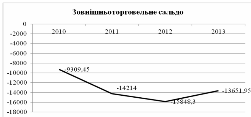
Рис. 1. Динаміка зовнішньоторговельного сальдо України у 2010-2013 роках, млн дол.

Основною причиною цього є те, що на сьогодні Україна є чи не єдиною країною у Східній Європі, що не має належної системи державного фінансування підтримки експортної діяльності підприємств на міжнародні ринки. Тому, за таких умов іноземні конкуренти мають переваги перед українськими експортерами за рахунок дешевих кредитів, компенсованих своїми державами на захист від політичних і частково комерційних ризиків.