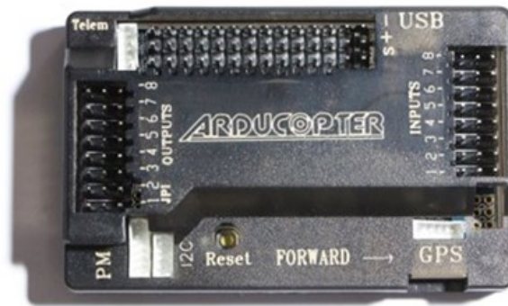
Рис. 1. контролер APM 2.6