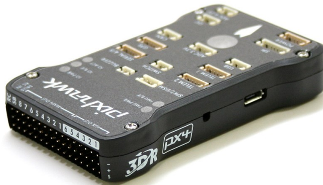
Рис. 2. Контролер Pixhawk

APM 2.6 є те що системи Pixhawk включають в себе багатопоточність в таких системах програмування, як Unix \ Linux, а так само оновлені режими автопілотування, таких як Lua Scripting, а спеціалізований драйвер PX4 дає більш тривалий час для польоту. Ці нововведення допоможуть розширити коло можливостей польотного пристрою.