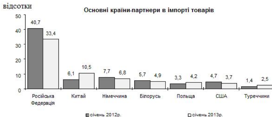
Рис. 3. Основні країни-партнери в імпорті товарів

Найбільші надходження здійснювались з Російської Федерації – 33,4%, Китаю – 10,5%, Німеччини – 6,8%, Білорусі – 4,9%, Польщі – 4,2%, США – 3,7% та Туреччини – 2,5%.