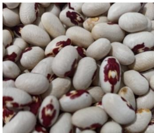
Світлина 6. Квасоля «з чоловічком».

З ЧОЛОВІЧКОМ з чоло|в'ічком. Сорт квасолі: з чоло|в'ічком др'іб'нен'ка / йсе|редин'ї |наче |образ л'у|дини (5).