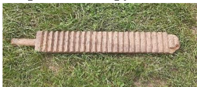
Світлина 10. Рубель.

РУБЕЛЬ рубел', ч. р. Зубчасте знаряддя для качання білизни.