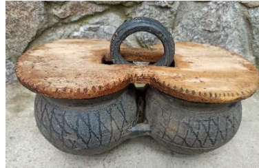
Світлина з Горнята-близнята.

БЛИЗНЯТА 2 близн'ата, мн. Посуд, що складається з двох однакових частин, у які насипали різні страви.