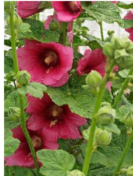
Світлина 7. Мальва.

МАЛЬВА ма|л'ва , ж. р. Рослина родини мальвових з високим стеблом та великими яскравими, різних кольорів квітками, зібраними в китицеподібне суцвіття; ружа .