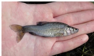
Світлина 11. Синька (чебачок амурський)

2. Чебачок амурський – риба родини корошових: |син'ку ше називайут |в'ечним к|л'овом / бо неч ўс|тигнечш за|кинути / йак обг|ризла ўс'у на|жиўку (2).