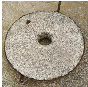
Світлина 5. Жорно.

ЖОРНЯНКА жор|н'анка, ж. р. Вертикальна вісь млину разом із насадженням на неї шестірнею.