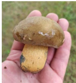
Світлина 9. Піддубник.

ПІДЖАК n·id|джак , n·i|жак , ч. р. Верхня частина костюма у формі куртки з рукавами й полами на гудзиках.