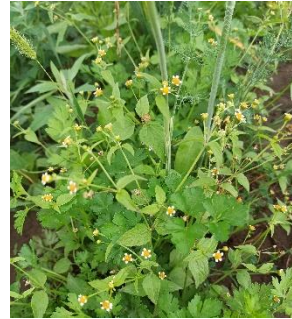
Світлина 8. Марічка.

МАРІЧКА ма|р'ічка, ж. р. Бур'ян-непаразит: ма|р'ічка куш|чом рос|те і б|і|лен'ким цв|і|те / мичку|вате та|ке ко|р'ін'.а (5).