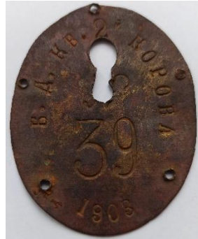
Світлина 2. Бірка на корову на 2-й квартал 1903 р.

БЛАГЕНЬКИЙ бла|ген'кий, прикм. Неміцний, старий (перев. про одяг).