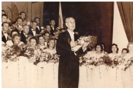
Світлина 1. Капела «Думка». Дмитрушки. 1962 р.

АРТИСТКА ар|т'їстка , ж. р. Та, хто публічно виконує твори мистецтва (акторка, музикантка, співачка та ін.).