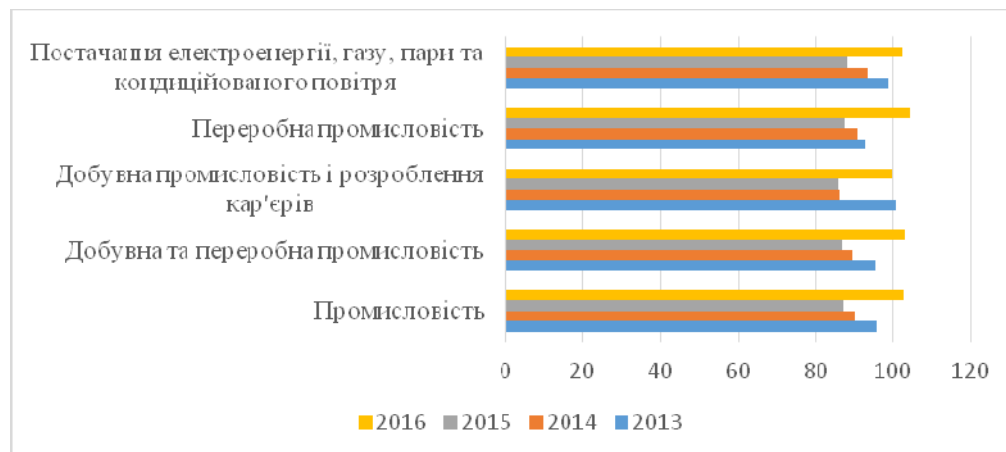
Рис. 1. Індекси промислової продукції за видами діяльності за 2013–2016 роки [5]

Індекси інвестування в промислову продукцію показують, що відбулось зростання у 2016 році порівняно з минулим, за всіма показниками. Особливо значного результату було досягнуто у переробній промисловості у розмірі 104,3%, що є різким зростанням, зважаючи на найбільший спад (87,4%) у 2015 році.