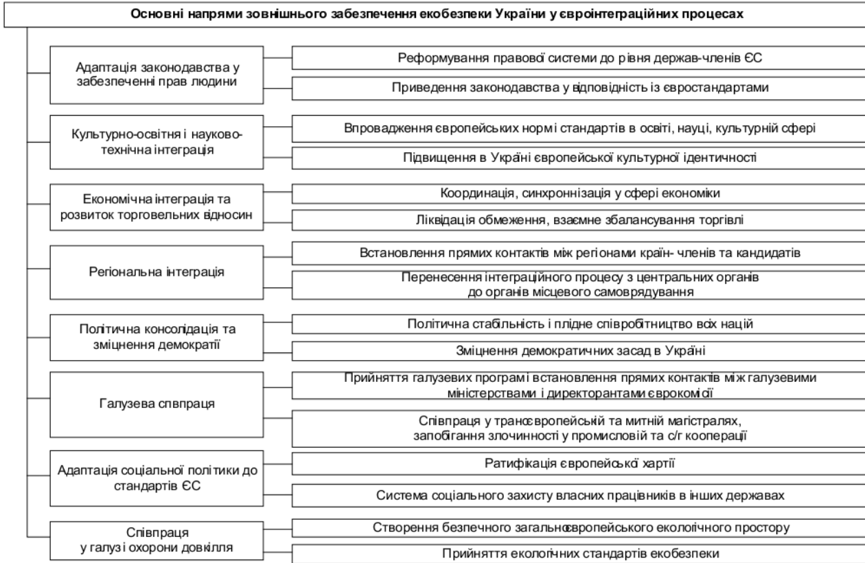
Рис. 1. Основні напрями зовнішнього забезпечення економічної безпеки України у євроінтеграційних процесах

Для забезпечення високого ступеня економічної безпеки України на зовнішньому рівні євроінтеграційний розвиток має відбуватися у напрямках, які вказані на рис. 1.