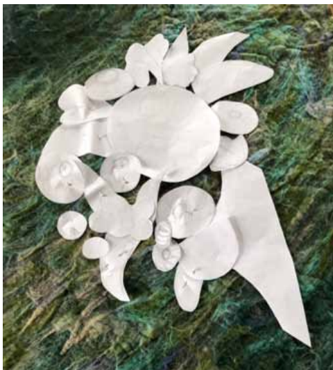
8. Виконання квітів півонії «плетеним швом»