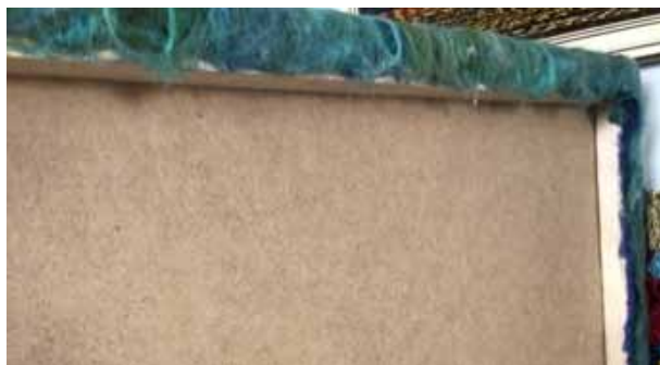
16. Завершений художній твір