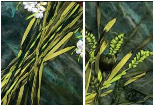
14. Доповнення композиції листям та стеблами рослин