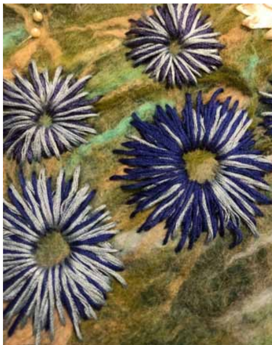
10. Виконання квітів майорів швом «прямий стібко»