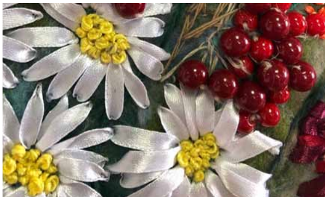
9. Виконання квітів ромашок швами «стрічковий стібко із завитком» та «французький вузлик»