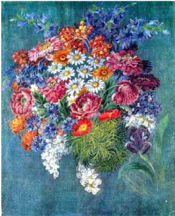
«Букет квітів», Катерина Білокур

1. Підбір ідеї та розроблення творчого задуму