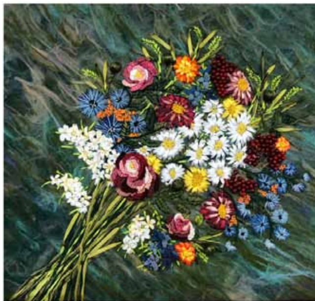
Рисунок 1. Декоративне панно «Серпанковий цвіт» за мотивами творів Катерини Білокур (автор Тереза Вандоляк, керівник Олена Самборська)

Виготовлене декоративне панно «Серпанковий цвіт» має розміри 60x70 см.