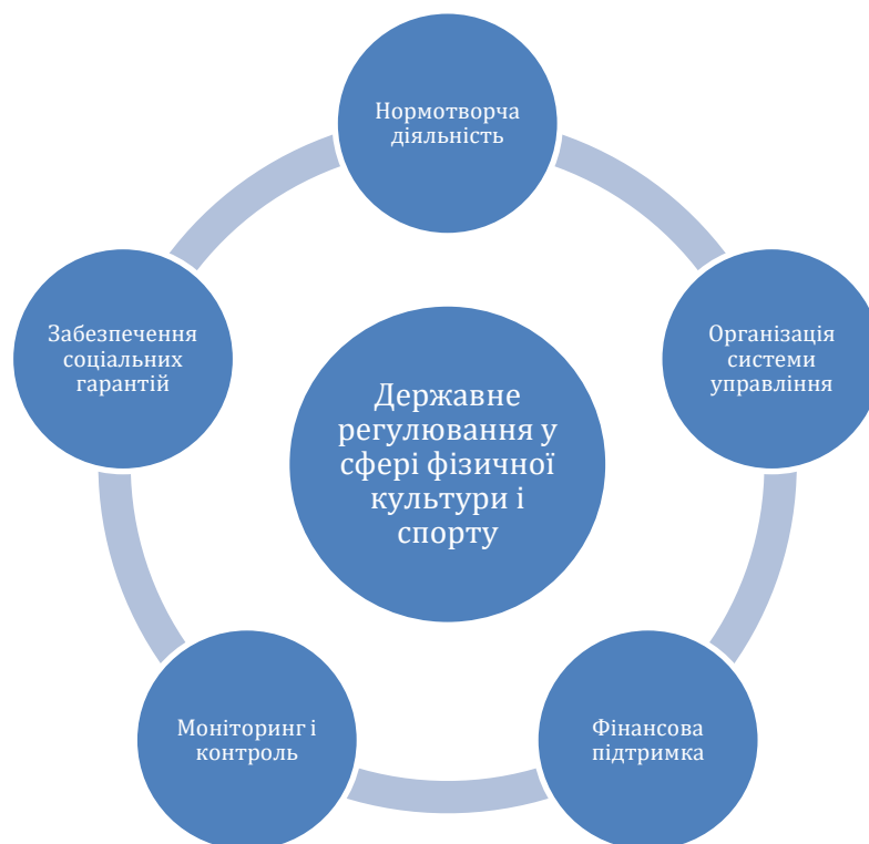
Рисунок 1.1. Компоненти державного регулювання у сфері фізичної культури і спорту

Аналіз спеціальних літературних джерел [23, 34, 46] дозволив виокремити наступні компоненти державного регулювання у сфері фізичної культури і спорту: нормотворча діяльність, організація системи управління, фінансова підтримка, контроль і нагляд, забезпечення соціальних гарантій (Рис. 1.1.)