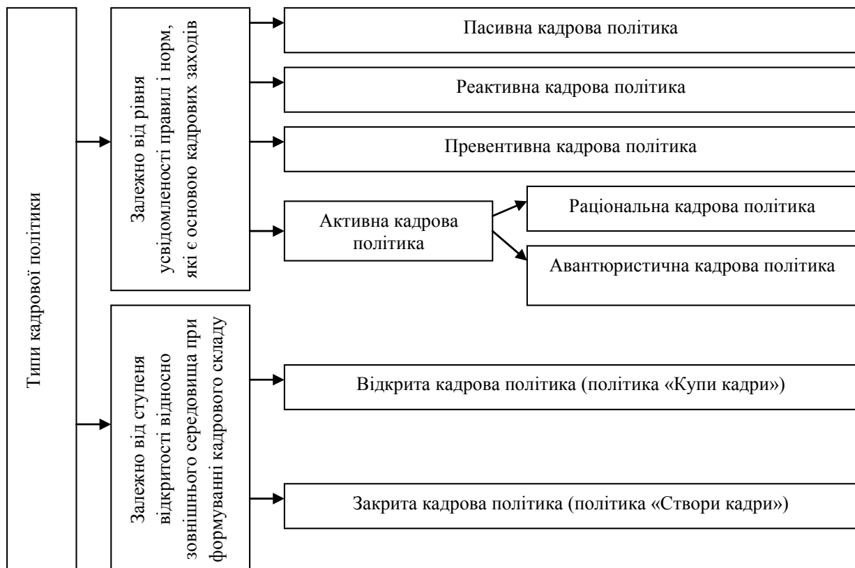
Рис. 2. Типи кадрової політики підприємства

Ще одна типологія кадрової політики заснована на визначенні цінностей, які лежать в її основі (рис. 2). Так, Д. МакГрегор сформулював ознаки авторитарного стилю управління у вигляді теорії «Х», а демократичного – теорії «У». Перша передбачає, що людина – істота від природи безвідповідальна, намагається працювати якомога менше. Тому управління персоналом, або кадрова політика, повинна будуватися на зовнішньому спонуканні, прямому регулюванні та контролі. Теорія «У» передбачає, що людина працелюбна, схильна до успіху, прагне до відповідальності, внутрішньо мотивована до праці. Тому управління персоналом повинно будуватися на принципі розподілу відповідальності і довірчих відносин.