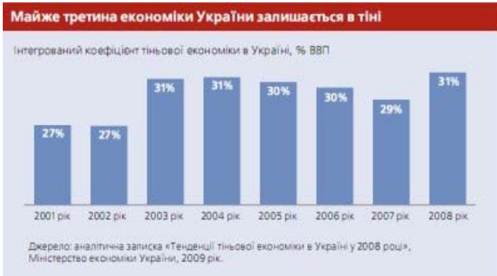
Рис. 2. «Тіньовий» сектор економіки України[5]

Внаслідок значних проблем, пов'язаних насамперед з недосконалим законодавством та складністю сплати