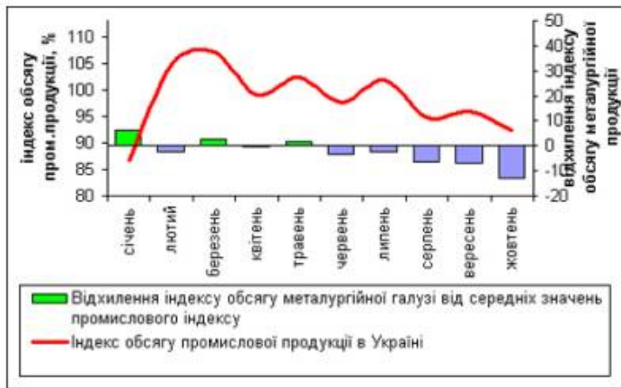
Рис. 1. Індекс обсягу промислової продукції в Україні в 2008 році[2].

Настання світової кризи значною мірою ослабило економічний потенціал України. Найвні глибинні проблеми економіки, низька конкурентоздатність промисловості посилює ефект від кризи для України. Вплив зовнішніх факторів, зменшення платоспроможності підприємств, зниження попиту на внутрішньому ринку, збільшення витрат витрат виступили основними