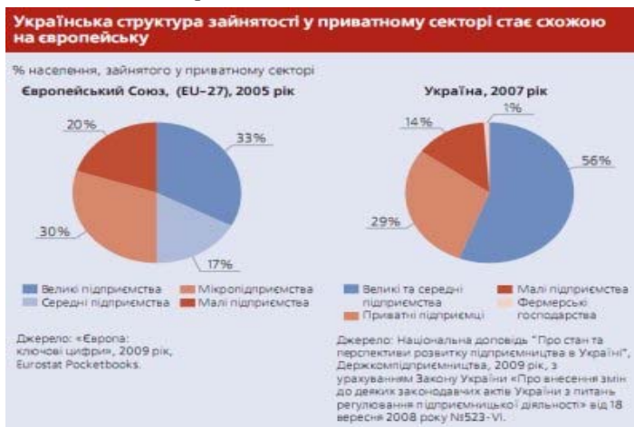
Рис. 3. З дослідження IFC «Інвестиційний клімат в Україні: яким його

Для попередження кризових явищ на підприємстві використовується фінансовий аналіз, що дозволяє у