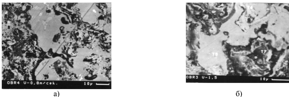
Рис.2 – Микрофотографии поверхностей трения аморфно-кристаллических покрытий в условиях граничного трения маслом МС-20 ( P=15 МПа): а – при V=0,8 м/с; б – при V=1,5 м/с;

Непосредственно над тонкопленочной структурой циркония, как селективно окисляющимся компонентом, по данным аналитических методов исследования поверхности, сформирована адсорбционная пленка, полярные молекулы которой, в частности длинноцепные углеводороды, присоединяются и удерживаются относительно поверхности трения главным образом в вертикальной ориентации высотой порядка 1,8нм. Образованный таким образом адсорбционный слой характеризуется рядом специфических свойств, из которых наиболее важным является высокая прочность на сжатие (более 110МПа) и значительная легкость сдвига под действием тангенциальных сил, что в свою очередь и обуславливает минимизацию коэффициентов трения при скольжении смазанных аморфно-кристаллических поверхностей. На рис. 2 и рис. 3 представлены поверхности трения исследуемых покрытий и соответственно их профилограммы.