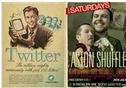
Рис. 5. Вінтаж в рекламі