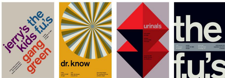
Рис. 7. Швейцарський стиль в рекламі

Швейцарський стиль виник в Швейцарії в 1940–50-х роках, є основою більшої частини графічного дизайну в ХХ ст. і продовжує зберігати свій вплив сьогодні з акцентом на легкість для читання і простоту. Основою візуальної комунікації швейцарського стилю послужили прості геометричні та абстрактні форми. Дизайн став науково обґрунтованим, з чіткою структурою і порядком. Відмінні риси швейцарського стилю – це відмова від національних особливостей і декору, що і робить цей стиль інтернаціональним (рис. 7).