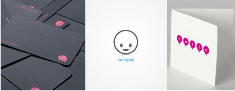
Рис. 1. Друкована реклама в стилі мінімалізм

Невід’ємна риса поп-арту це використання яскравих образів зірок політики, шоу-бізнесу та кіно. Поп-арт орієнтований на молодь звідси береться його несерйозність і пропагується споживацьке ставлення. Можливо, завдяки використанню комерційних зображень, поп-арт зараз є одним з найбільш впізнаваних стилів сучасного мистецтва і графічного дизайну (рис. 2).