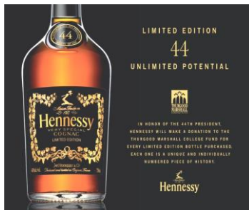
Рис. 4. Реклама алкоголю в стилі ампір

Ампір (фр. Empire style – імперський стиль) виник у Франції в другій половині ХІІІ ст., завершуючи своїм початком останній етап класицизму. Цей імперський стиль характеризується величчю, потужністю, монументальністю. Ампір – це багате декорування з вмістом елементів військової символіки. Художні форми запозичені насамперед у культури стародавнього Риму, Греції і Єгипту. Ампір був покликаний, щоб підкреслювати ідею могутності влади і держави, наявність сильної армії. Звідси і відповідний декор – це лаврові вінки, щити, обладунки, орли тощо. Цей графічний стиль найчастіше використовується виробниками алкогольної продукції, підкреслюючи мужність і солідність марки (див. рис. 4).