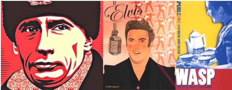
Рис. 2. Використання стилю поп-арт в рекламі

Невід’ємна риса поп-арту це використання яскравих образів зірок політики, шоу-бізнесу та кіно. Поп-арт орієнтований на молодь звідси береться його несерйозність і пропагується споживацьке ставлення. Можливо, завдяки використанню комерційних зображень, поп-арт зараз є одним з найбільш впізнаваних стилів сучасного мистецтва і графічного дизайну (рис. 2).