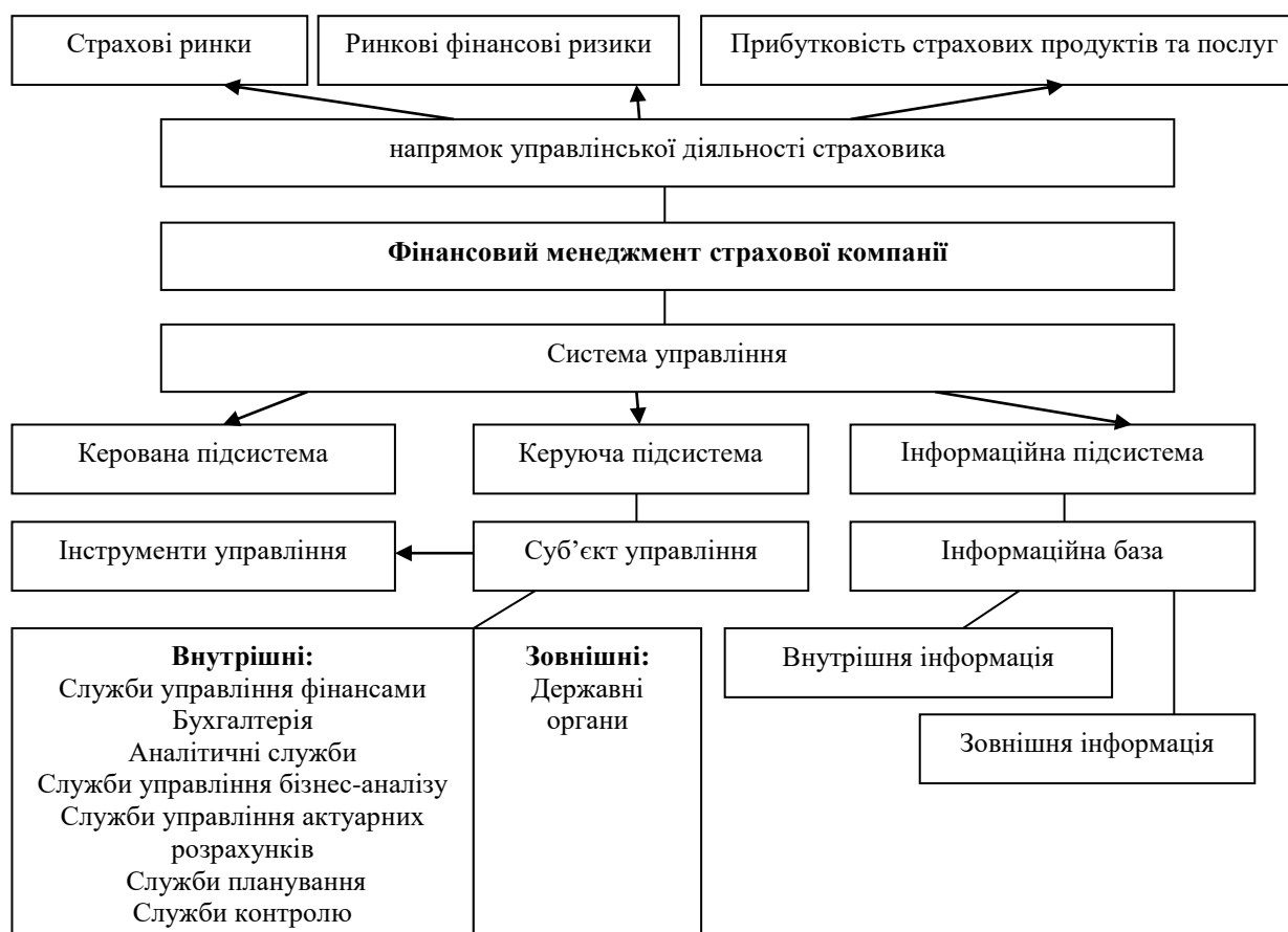
Рис. 1. Сутність та елементи фінансового менеджменту страхової компанії (складено на основі [1– 6 та ін.]

Як напрямок діяльності фінансовий менеджмент страхової компанії представляє собою діяльність, яка охоплює питання, пов'язані з страховими ринками, його фінансовими ризиками, прибутковістю та ефективністю використання окремих видів страхових продуктів та послуг. Він включає управлінську діяльність, пов'язану з: визначенням потреб у фінансових ресурсах, виявленням всіх альтернативних джерел фінансування та їх оцінкою; практичним одержанням фінансових ресурсів та ефективним їх використанням.