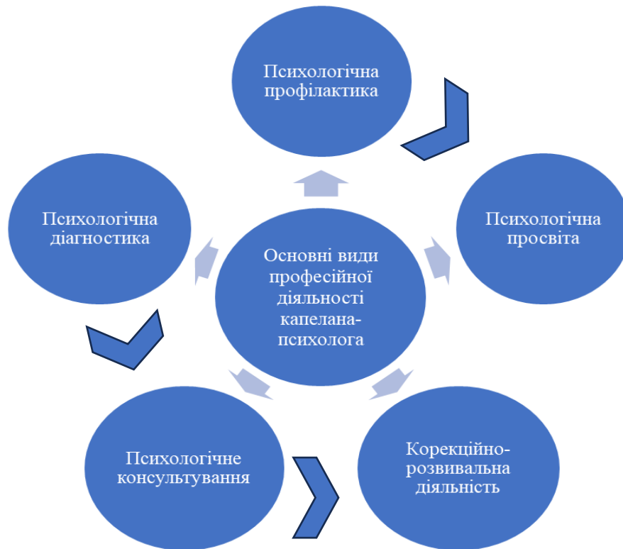
Рисунок 2.2. Складові професійної діяльності капелана-психолога

Варто зауважити, що психодіагностика передбачає встановлення психологічного діагнозу шляхом застосування психодіагностичного інструментарію. Психологічна діагностика вимагає від фахівця вибору конкретної методики дослідження задля виявлення у клієнта певних поведінкових особливостей, психологічних властивостей, визначення ступеня їх виразності, встановлення правильних характеристик, виявлених властивостей стосовно інших індивідів, опис діагностованих поведінкових та психологічних особливостей особи. Психодіагностики вважають, що під час проведення роботи з клієнтом необхідно враховувати різні фактори впливу. Вибір психодіагностичного інструментарію повинен відповідати поставленій меті [41; 75].