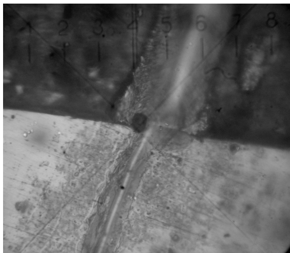
Рис. 1 – Покриття Ni + BN з треком для визначення міцності зчеплення з основою (x 462)

Для отримання порівняльних даних в роботі досліджено міцність зчеплення гальванічних нікелевих покриттів, КЕП без термічної обробки та КЕП з термічною обробкою. На рис. 1 представлено фотографію поперечного мікрошліфа покриття Ni + BN з треком (утворення канавки) для визначення міцності зчеплення з основою.