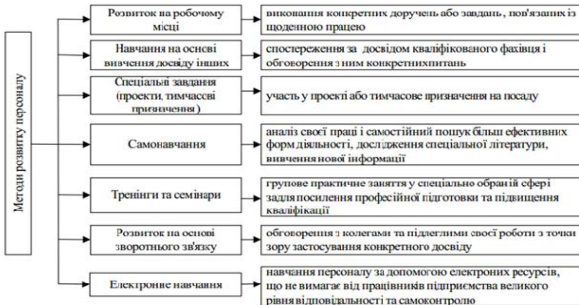
Рис. 4. Сучасні методи розвитку персоналу

Працівники такого центру використовувати різні методи навчання і розвитку персоналу компанії: від зовнішніх програм до більш бюджетного навчання на робочому місці. Сучасний підхід являє собою використання декількох методів розвитку навчання та перепідготовки персоналу одночасно (Рисунок 4).