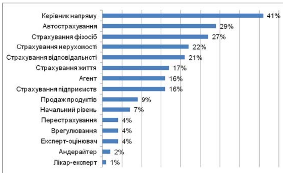
Рис. 1. Структура вакансій зі страхування в 2012 році

Всього 2012 році в страхові компанії пропонували близько 1000 вакансій [3].