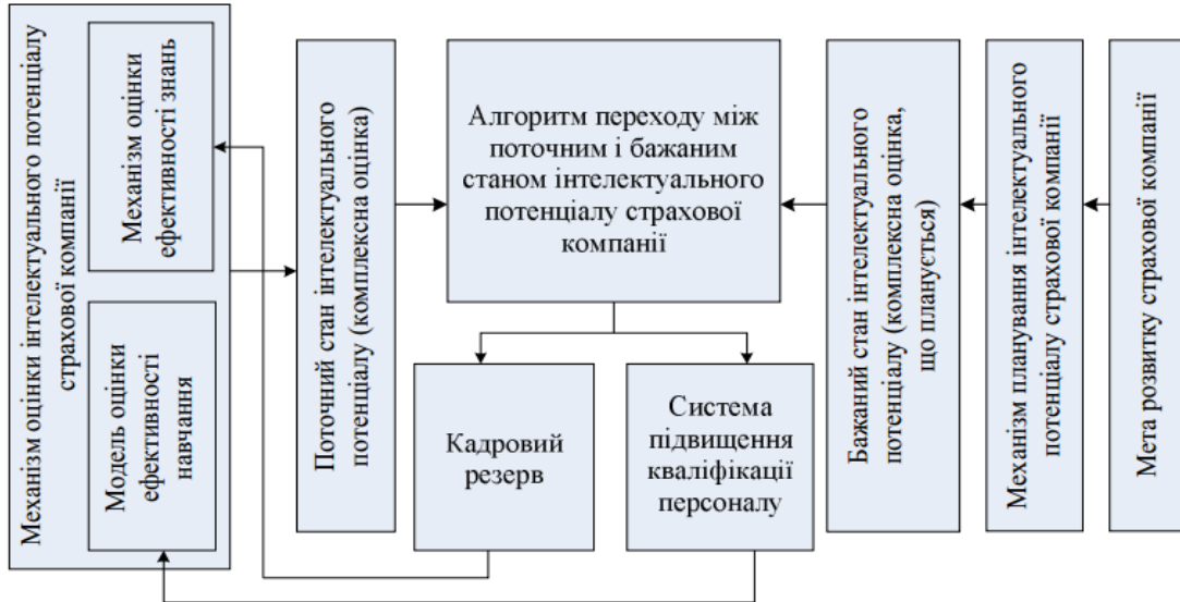
Рис. 2. Механізм управління розвитком інтелектуального потенціалу страхової компанії

Механізм управління розвитком інтелектуального потенціалу страхової компанії подано на рисунку 2.