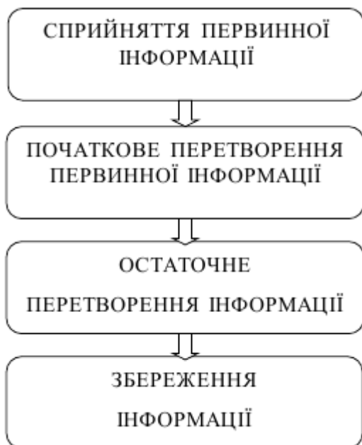
Рис. 1. Схема інформаційного потоку

Розглянемо загальний підхід до метрологічної оцінки вимірювального комплексу, технічна реалізація якого наведена у роботах [4, 5], а програмне забезпечення – в роботі [17].