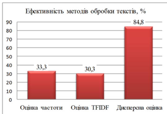
Рис. 2. Діаграма ефективності методів обробки текстів