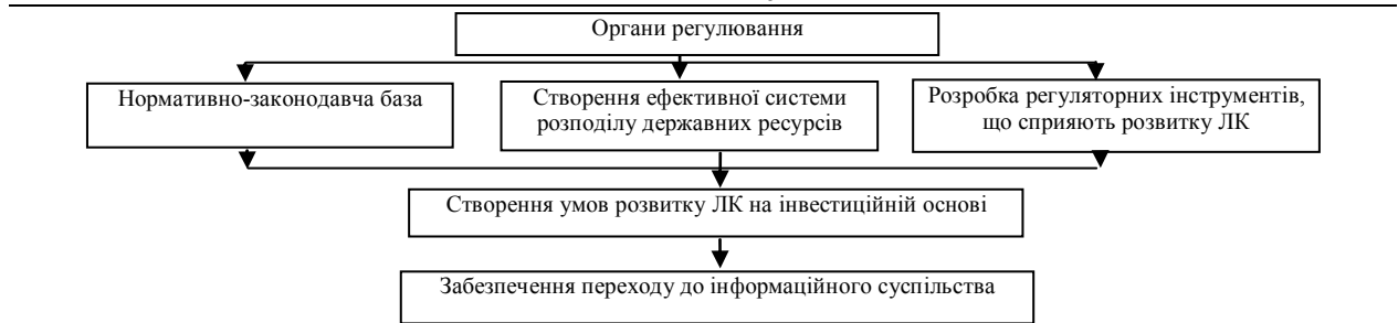
Рис. 1 Організаційно-економічні напрями розвитку людського капіталу на інвестиційній основі

Держава виступає основним регулятором, що сприяє реалізації завдань та цілей проектного механізму інвестування в людський капітал з врахуванням чинників його формування, мотивів, джерел та інструментів інвестування, макроекономічних ефектів (рис. 2).