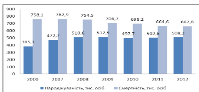
Рис. 4. Динаміка народжуваності та смертності в Україні за 2000-2012 роки

Джерело: побудована автором на основі статистичних даних [4].