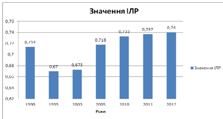
Рис. 2. Динаміка показників ІЛР України за 1990-2012 роки

Україна має значні перспективи щодо підвищення рівня ІЛР. Про це свідчать показники очікуваної тривалості навчання та очікуваної тривалості життя. За період з 1990 до 2012 рр. значення ІЛР України зросло з 0,714 до 0,740, або на 3,6%.