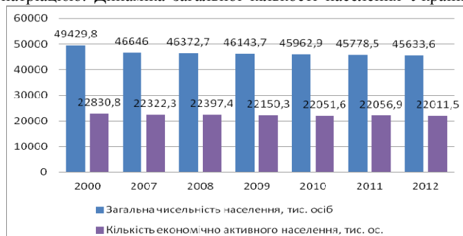
Рис. 3. Динаміка загальної кількості населення України до кількості її економічно активного населення за 2000-2012 роки

Найбільшими демографічними проблемами в Україні нині є низький рівень народжуваності, значні темпи смертності, швидке старіння населення і слабкокеровані міграційні процеси, що порушують демографічний баланс в нашій державі. Так, за даними Всесоюзного перепису населення 1989 р., в Україні проживало 51,45 млн. осіб. До середини 1992 р. кількість населення продовжувала зростати і сягнула 52 млн. 224 тис. осіб, що забезпечувалося репатріацією. Динаміка загальної кількості населення України до кількості її економічно активного населення за період 2000-2012 р.р. представлена на рис. 3.