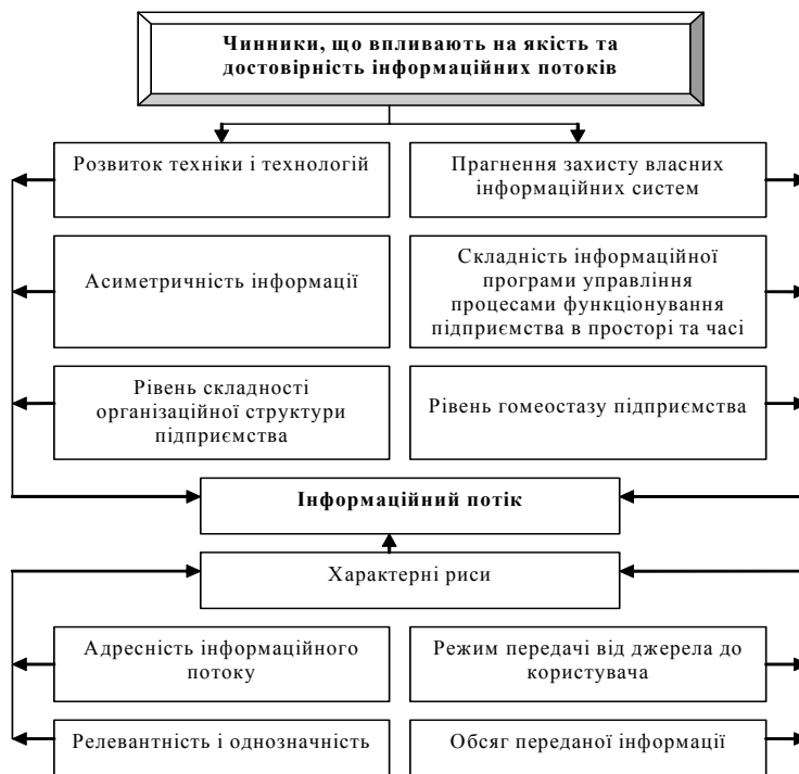
Рис. 1. Характерні риси і чинники інформаційних потоків

Відповідно, постає потреба у визначенні основних чинників, що впливають на якість та достовірність потоків інформації, що надходять на підприємства та систематизації їхніх характерних ознак (рис. 1).