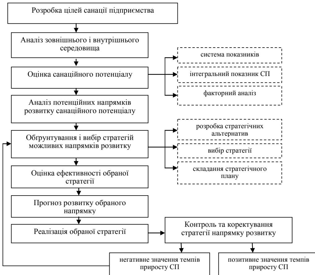
Рис.2. Процедура розвитку санаційного потенціалу підприємства